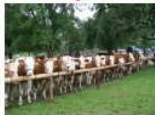
Regelmässige Staatsprämierung der Fleckviehzuchtbetriebe